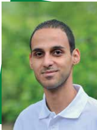
Fehér György Zsigmond Király Főiskola Szociológia (BA)