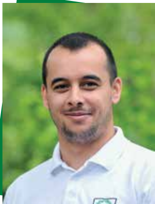
Farkas András Liszt Ferenc Zeneművészeti Egyetem Előadóművészet- Klasszikus ének szakirány (BA)