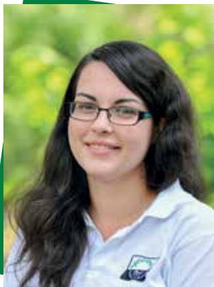
Dávid Alexandra Eötvös Loránd Tudományegyetem Tanító (BA) Budapesti Műszaki és Gazdaságtudományi Egyetem Műszaki menedzser (BSc)